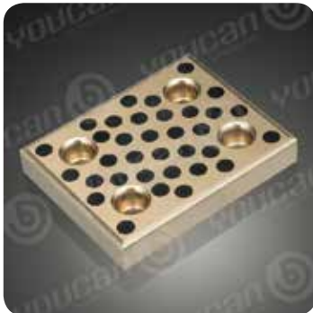
●运动方向为纵横两方向

请从适用的长度、宽度、厚度中选择零件号 (例)内径25mm、外径33mm、长度20mm的情况下